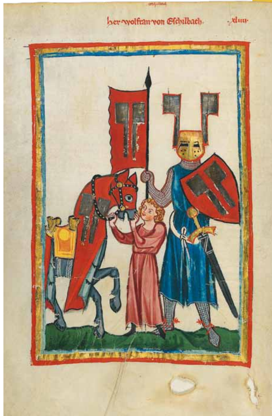
Wolfram von Eschenbach in Ritterrüstung. Aus der Manesse Handschrift