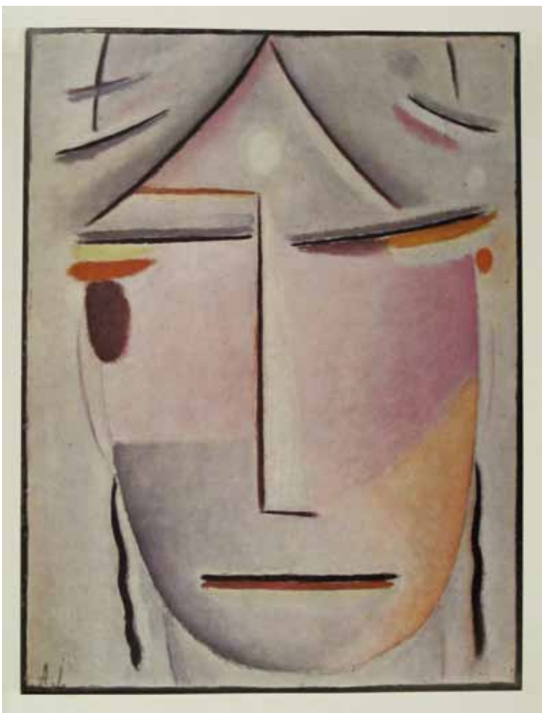
Alexej Jawlensky, Heilandsgesicht

Sonntag, 11. Mai 2014, 10.00 bis 17.00 Uhr