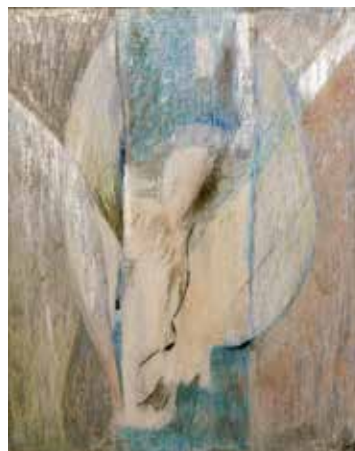
„MUT WIRD ZUR ERLÖSERKRAFT“ VON GABRIELE ARNDT

Die Kunstwerke wollen den Ereignissen in diesem Jahr einen friedfertigen und hoffnungsvollen Ausblick auf die Zukunft entgegenstellen.